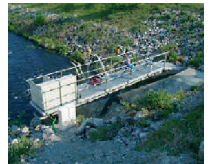
Relevé niveau et débit d'eau