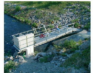
Relevé niveau et débit d'eau