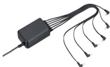
KSC-44ML [M] ADAPTATEUR SECTEUR (pour une connexion multiple jusqu'à 6 unités)