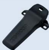
KBH-14 [M] CLIP CEINTURE