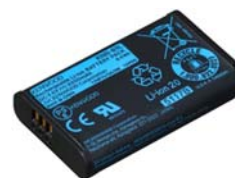
KNB-81L [W] BATTERIE Li-ion (3.6 V / 2200 mAh)