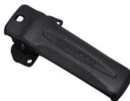
KBH-21 [W] CLIP CEINTURE (50mm)