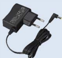
KSC-44SL [E] ADAPTATEUR SIMPLE