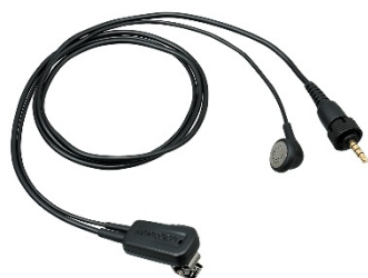
EMC-13 [W] MICRO CLIP AVEC OREILLETTE ET PTT