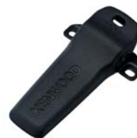
KBH-14 [M] CLIP CEINTURE (court)