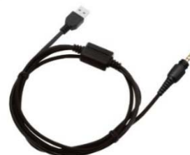
KPG-186U [W] CABLE DE PROGRAMMATION USB -1pin