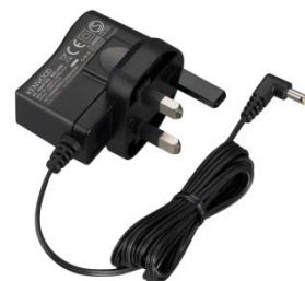
KSC-44SL [T] ADAPTATEUR SECTEUR (prise UK) (SIMPLE)