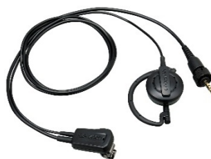
EMC-14 [W] MICRO CLIP AVEC TOUR D'OREILLE ET PTT