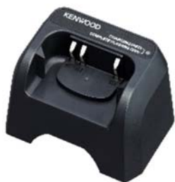
KSC-50CR B [W] SOCLE CHARGEUR