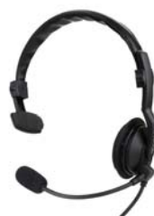
KHS-7A-SD CASQUE LEGER AVEC TIGE MICRO ET PTT