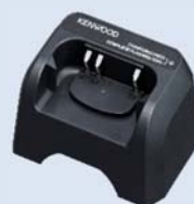
KSC-50CR [W] SOCLE CHARGEUR