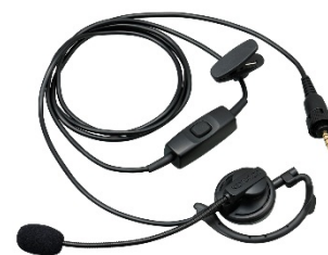
KHS-37 [W] TOUR D'OREILLE AVEC TIGE MICRO ET PTT