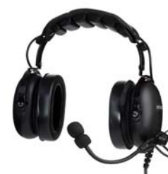
KHS-10-OH-SD CASQUE MILIEU BRUYANT