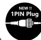
Connecteur 1-pin SP-Mic

Connecteur compatible avec la série ProTalk FD WD-K10