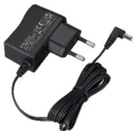
KSC-44SL [E] ADAPTATEUR SECTEUR (prise EU) (SIMPLE)