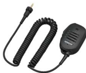
KMC-55 [W] MICRO HP DÉPORTÉ (IP54/55/67, Touche PF, Jack 2.5mm)