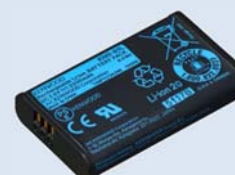
KNB-81L [W] BATTERIE Li-ion (3.6 V / 2200 mAh)